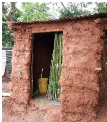
Arquitectura tradicional de la cultura