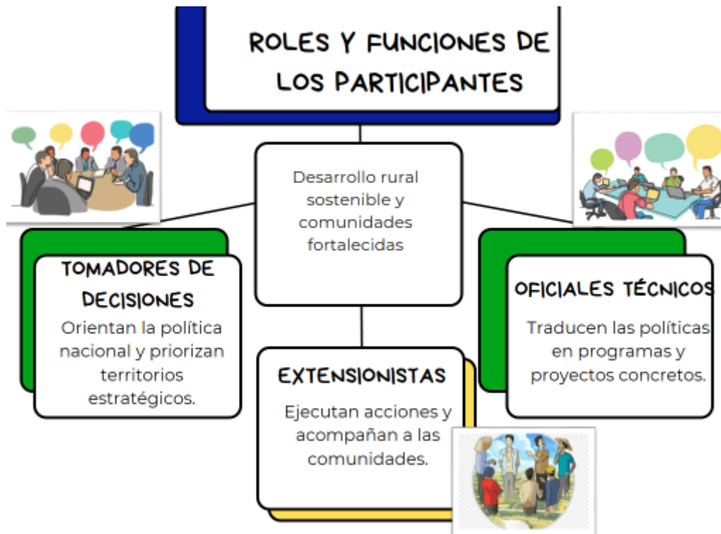
Rol y función de los participantes

Se priorizará la participación de funcionarios técnicos y extensionistas responsables de la ejecución y acompañamiento de programas de extensión y desarrollo rural en sus respectivos países.