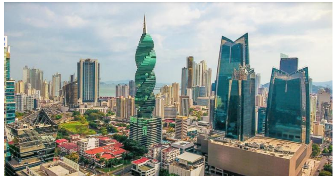
Ciudad de Panamá

Las actividades del programa se desarrollarán en diferentes localidades del país, combinando sesiones teóricas y prácticas.