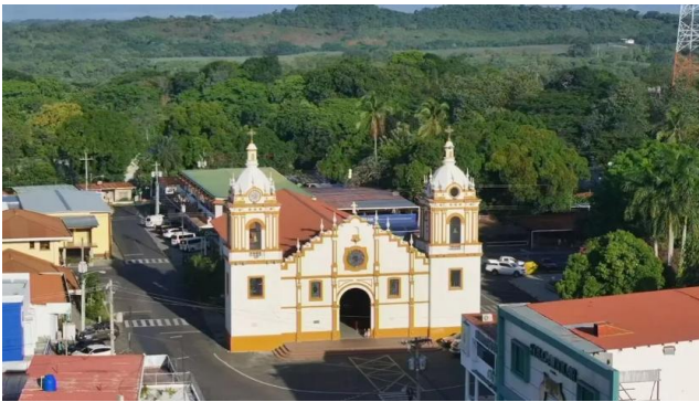
CATEDRAL DE SANTIAGO APÓSTOL, SANTIAGO DE VERAGUAS.

Los módulos teóricos se impartirán en salones de capacitación ubicados en la Ciudad de Panamá (Figura 1) y en la Ciudad de Santiago de Veraguas (Figuras 2). Vistas de la Ciudad de Santiago y de la Ciudad de Panamá.